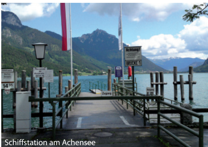
Schiffstation am Achensee